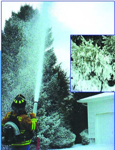
Un alcance extendido