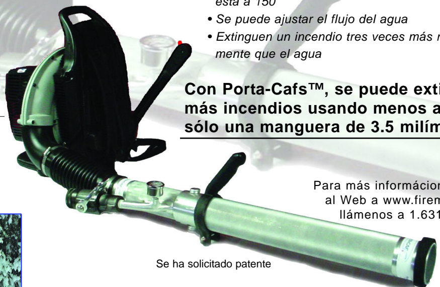
Se ha solicitado patente

Con Porta-Cafs™, se puede extinguir más incendios usando menos agua con sólo una manguera de 3.5 milímetros.